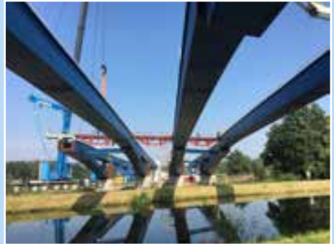
A14 VKE 6 Bau der Eldetalbrücke

Vereinigung der Straßenbau- und Verkehrsingenieure e.V.