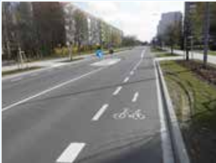
Umbau der Rigaer Straße in HRO