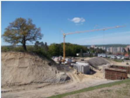
B96 OU Neubrandenburg