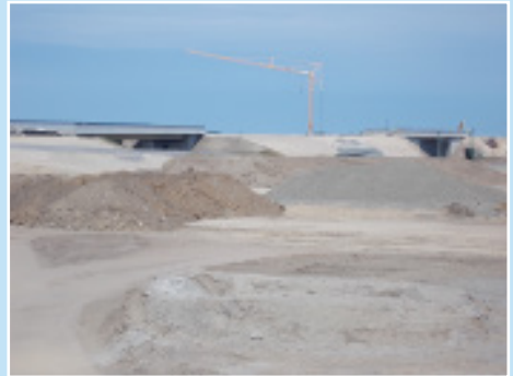
B196 bei Bergen auf Rügen